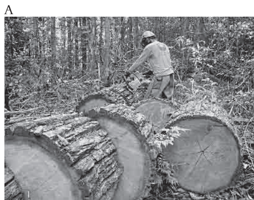
Figura 1. Passos para a produção das telhas de madeira (cavacos). (A) Traçamento da árvore para a confecção dos toretes (~55 cm de comprimento); (B) Divisão dos toretes em secções para a confecção dos cavacos; (C) Fixação da secção e utilização da faca de cavaco para produzir as peças; (D) Limpeza das peças com um facão para remover imperfeições e farpas de madeira; (E) Instalação dos cavacos na estrutura de telhados (Crédito das fotos: IFT, 2011).